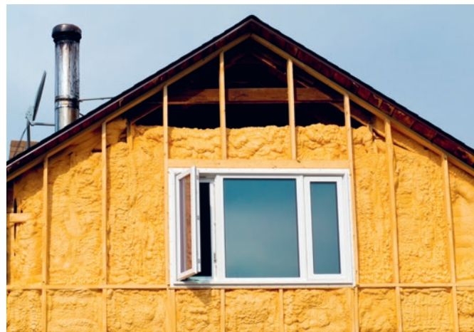
Die Mittel des Gebäudeprogramms werden nicht voll ausgeschöpft.

Auf den ersten Blick fällt auf, dass für die «Einzelbauteile» Fenster und Dachdämmung keinerlei Fördergelder zur Verfü-